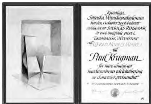
FIGURA 1 Targeta del Premi Nobel d'Economia, concedit a Paul Krugman

El disseny artístic dels diplomes ha anat variant al llarg dels anys, car la Reial Acadèmia de les Ciències sueca (Royal Swedish Academy of Sciences) els ha encarregat des dels seus inicis a artistes diferents, des de Sofia Gisberg (1901-1926) fins a Tage Hedqvist (1975-1976), o, més recentment, a Nils G. Stenqvist (1999-2004). Malgrat això, sempre han seguit el mateix patró. Els diplomes s'han caracteritzat sovint per un tema anual —com podrien ser flors, ocells o gots—,