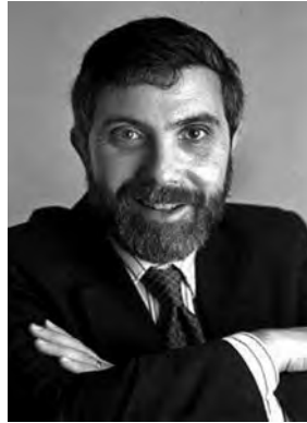
FIGURA 2 Paul R. Krugman

comunitat acadèmica, més, fins i tot, que el mateix Premi Nobel. Seguint amb els premis, l'any 2004 se li atorga el Premi Príncep d'Astúries de Ciències Socials, i el 13 d'octubre del 2008, el Nobel d'Economia.