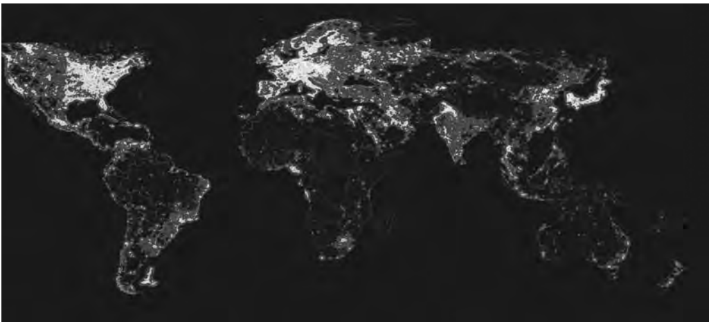
FIGURA 7 Món nocturn

Per concloure la conferència, m'agradaria fer esment d'una paradoxa del nostre temps: en el mateix moment que la tecnologia permet una distribució geogràfica més gran de l'activitat econòmica, aquesta continua concentrant-se al voltant de les mateixes regions. Aquesta és una màxima que s'hauria de tenir en compte per obrir el debat sobre si l'eix mediterrani hauria de constituir una economia d'aglomeració o si l'economia hauria d'emergir espontàniament. Això sí, sense oblidar les paraules de Zhou Enlai.