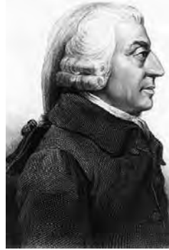
FIGURA 4 Adam Smith

Ara bé, què significa ser «millor a produir»? Es pot quantificar la capacitat de cada país per elaborar un producte de dues maneres equivalents: mesurant la productivitat del treball —el nombre d'unitats que un treballador pot obtenir en una hora— o considerant el nombre d'hores que un treballador necessita per obtenir una unitat de producte —exactament la inversa de la productivitat del treball. Un país tindrà avantatge absolut en un bé si la productivitat del treball d'aquest bé és més gran en el país que a la resta del món. Si no hi hagués comerç, cada país hauria de produir tots els béns per satisfer-ne la demanda, mentre que, si s'obre al comerç, cada nació podria desplaçar els seus recursos cap a la producció del bé en què té avantatge absolut.