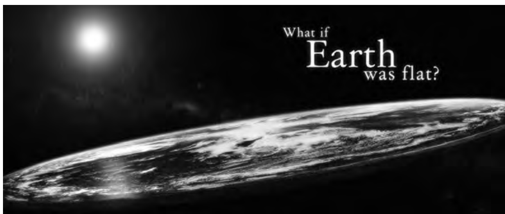
FIGURA 6 La Terra és plana

Aquests canvis en les esferes econòmica, tecnològica i política han anat configurant un món a principi del segle XXI en el qual la ideologia predominant ha estat la neoliberal; i la representació més cridanera i persuasiva ha estat la d'un món pla («the world is flat»). Aquesta imatge intentava reflectir un acostament, una homogeneïtzació de totes les parts del món.