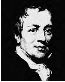
FIGURA 5 David Ricardo

portarà aquells béns i serveis que, d'altra manera, produiria a un cost d'oportunitat elevat. S'ha d'aclarir que la paraula clau és comparatiu , en el sentit que és «relatiu» i «no necessàriament absolut». Malgrat que un país fos més productiu en termes absoluts en la producció de tots els béns i un altre, menys productiu en termes absoluts, ambdós poden guanyar comerciant entre si, sempre que els seus avantatges relatius produint els diferents béns no siguin iguals. Tots poden beneficiar-se del comerç exportant aquells productes en els quals tinguin un avantatge relatiu més gran i important aquells béns en els quals tinguin un avantatge relatiu més petit. L'enfocament de Ricardo consisteix, realment, en una doble comparació entre països i productes.